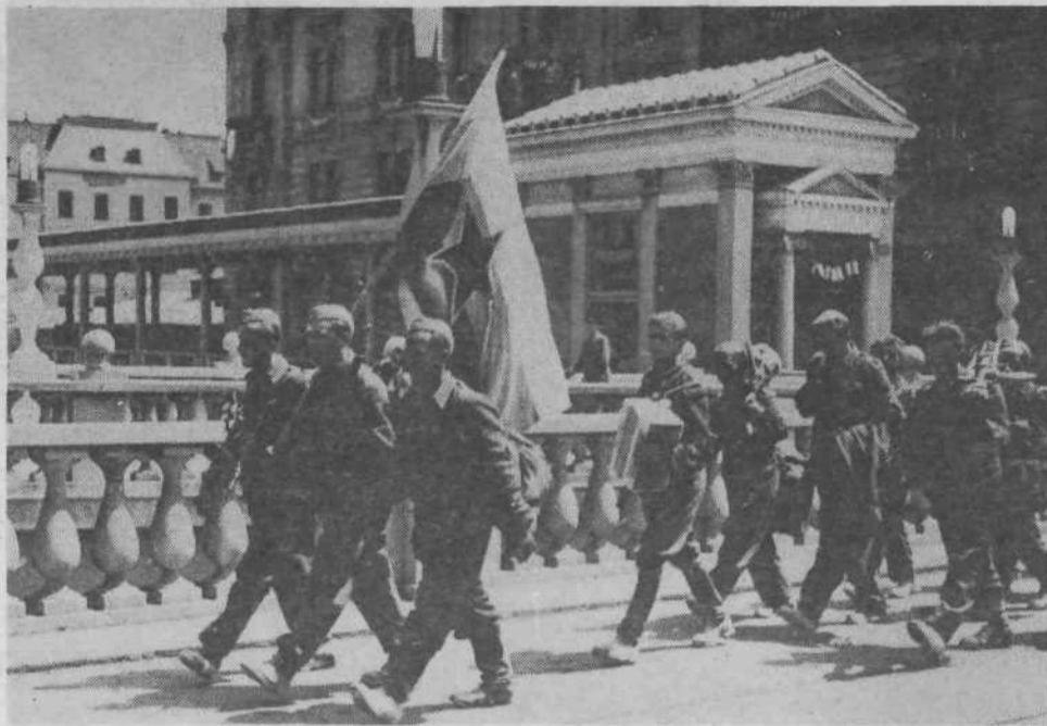
Štiri leta po prihodu prvih okupatorjev je prišla svoboda.

Kljub vsem tem prizadevanjem pa je to področje našega delovanja še vedno med bolj perečimi vprašanji. Verjetno bo treba v krajevni skupnosti zbrati določena finančna sredstva, s katerimi bomo